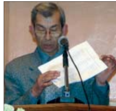
Вот такой список Правления МГНОТ