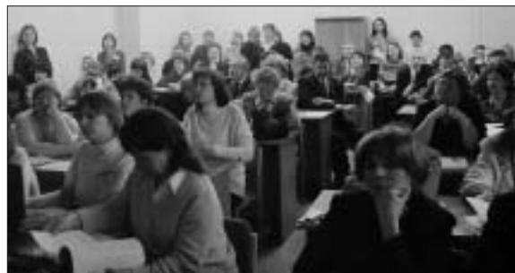
На столы садиться отказались

Во-вторых публички было пожиже, никто не падал в очередях на вход и не рвал одежду, в попытке прорваться к стенду фирмы. Впечатление, что стендов фармкомпаний стало меньше, правда, они пообъединились и укрупнились. Укрупнились и стенды. Но все