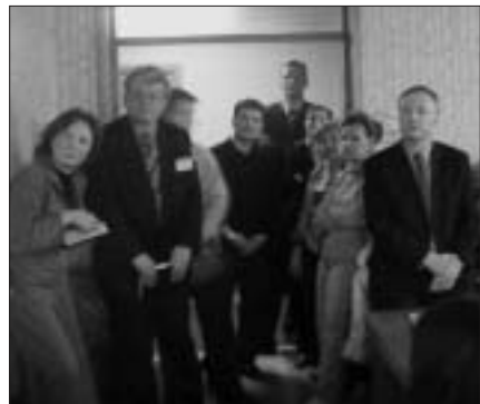
Президиум стоит — стулья слушателям

щина, превращающаяся в пропасть между чиновниками, учеными и врачами нарастает.