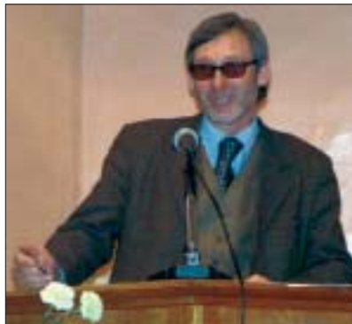
Докладывает ревизионная комиссия

ний, вновь, как и прежде, на обществе появилась молодежь, которая, как ей и положено, осваивает галерею.