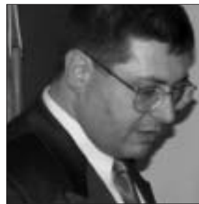
Говорит и показывает Волгоград