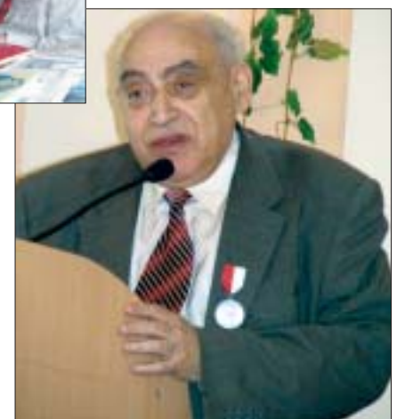
Ответное слово с медалью им. П. Эрлиха на груди