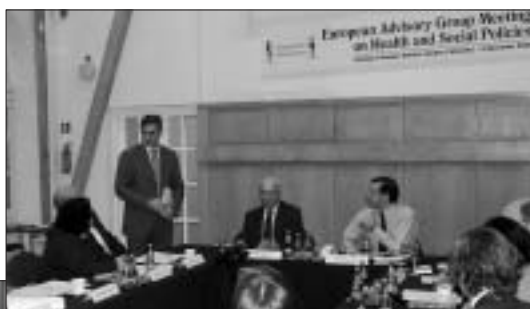
Все внимательно слушают

2-го декабря в Варшаве (Колледж Европы) пошла вторая встреча экспертов стран Восточной Европы (Польша, Россия, Чехия и Словакия), Турции, Бельгии, Великобритании. Россия прошла по этому пути дальше соседей — работает Форумный комитет, проводящий экспертизу, существует независимый Институт оценки медицинских технологий, имеются стандарты клинико-экономических исследований и создания позитивного перечня лекарств (жизненно важных), разрабатываются иные документы (положения по редко используемым и негативным — не рекомендуемым — технологиям). Вместе с этим очевидно, что мы находимся лишь в начале пути.