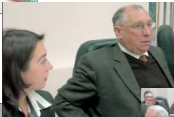
Председательствует академик А.М. Егоров, секретарь М. Сура

Перечень жизненно необходимых лекарственных средств должен формироваться для обеспечения госпитальной помощи и соответствовать «стационарным» стандартам — такова логика. В настоящее время Минздравсоцразвития с участием экспертов в том числе и Формулярного комитета разработано около 150 стандартов госпитальной помощи, 50 уже утверждено. Секретариатом комитета была произведена выборка лекарств из утвержденных стандартов и в виде дополнений они были внесены в существующий перечень, утвержденный Правительством страны в 2004 г.